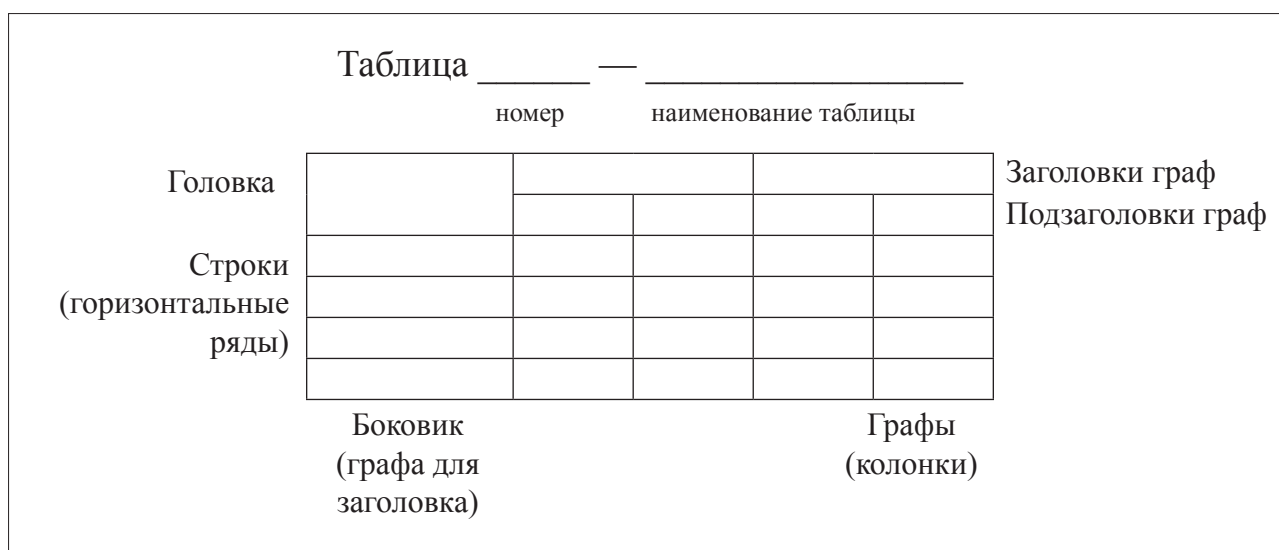
Рис. 2. Пример оформления таблицы

Цифровой материал, как правило, оформляют в виде таблиц. Пример оформления таблицы приведен на рисунке 2.